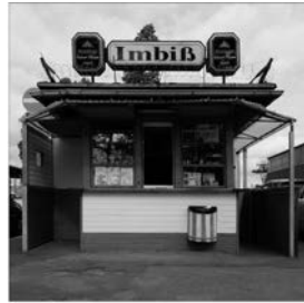
Fotografien von Klaus D. Dehler Ausstellungsdauer bis 30. August

Die Geburtsstunde der Frankfurter Wasserhäuschen schlug etwa um 1870. Ursprünglich wurde dort so genanntes Klicke Wasser verkauft, was zentral zur Namensgebung beitrug. Später wurde das Sortiment um alkoholische Getränke, Schokolade, Tabak und Zeitungen erweitert. Ab dem Jahr 1938 wurden viele Wasserhäuschen gezielt abgerissen. Der Grund: Sie waren schwer zu kontrollierende Treffpunkte der Arbeiter. Nach dem zweiten Weltkrieg dienten die verbleibenden und teilweise neu entstandenen Wasserhäuschen als zentrales Element der Versorgungsinfrastruktur, heute existieren noch etwa 80.